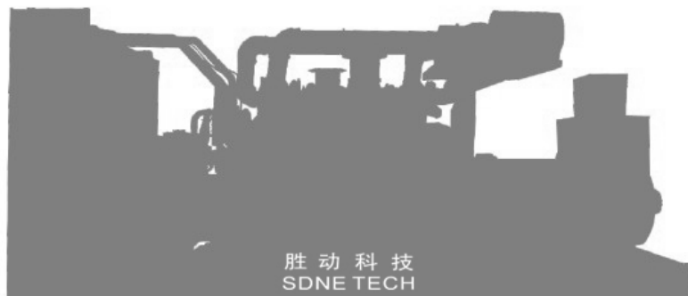
开架式机组 尺寸及重量