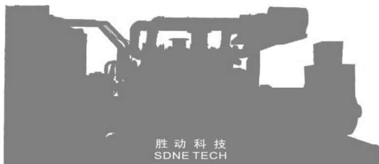
开架式机组 尺寸及重量